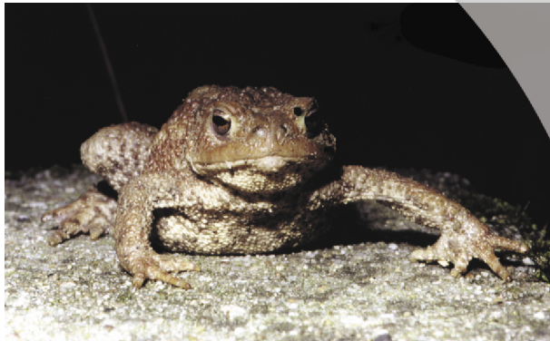
Foto Schild: Helge May, Foto Kröte: Margarete Daumann, Text: Christine Börner

So gab es wieder viele Einsätze vom NABU Alzey und sonstigen Krötenfreunden, die die Tiere über die Strasse brachten. In anderen Landkreisen werden während der Krötenwanderung Strassen abends gesperrt, im Kreis Alzey wurde dieser Vorschlag immer wieder von den zuständigen Behörden abgeblockt. In diesem Jahr wurde nun ein neuer Anlauf genommen: es gab einen Termin beim Landrat, und wir schilderten ihm die mißliche Situation. Das Resultat war, dass entweder ein funktionsfähiges Tunnelsystem gebaut oder über die Sperrung der Strasse während der Wander-